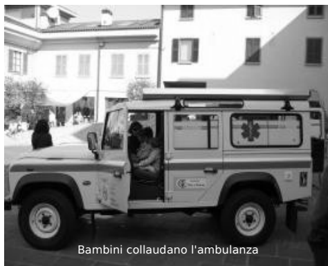
Bambini collaudano l'ambulanza